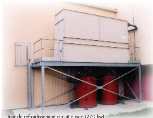
Tour de refroidissement circuit ouvert (270 kw) : refroidissement pour ligne de traitement thermique