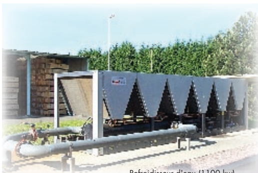
Refroidisseur d'eau (1100 kw)