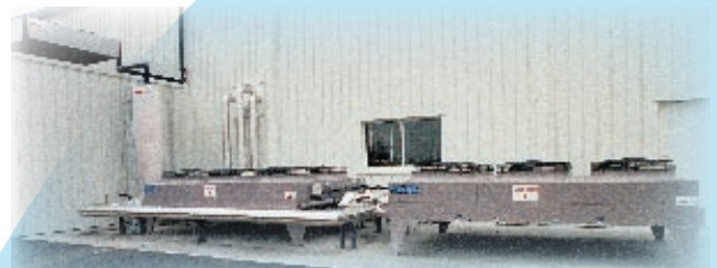
Aérofrigorant circuit fermé (300 kw) : refroidissement bain d'huile de presses à injecter