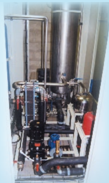
Refroidissement et distribution eau déminéralisée (2 micro siemens)