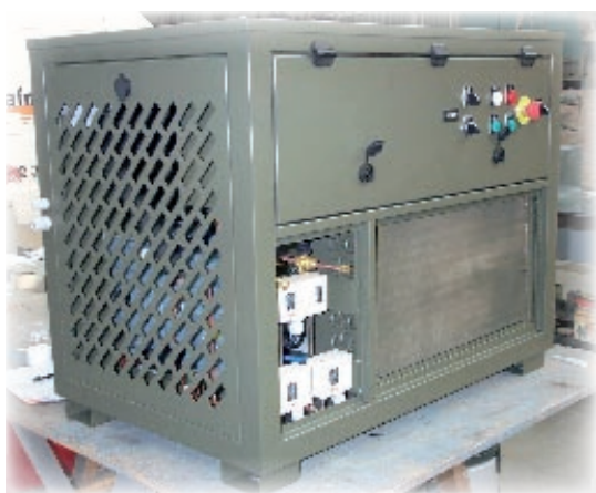
Equipement frigorifique pour conteneurs Températures intérieures : +3°C/-22°C Températures extérieures : +43°C/-25°C