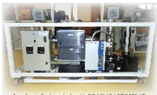
Banc d'essai - Simulateur de climat (de 0°C 15% HR à 37°C 90% HR)